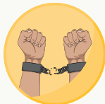
Trata y/o tráfico de personas